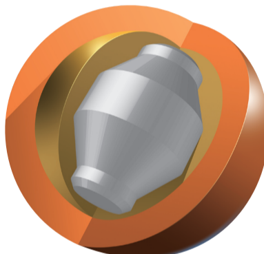
一方、マイボールのコアは、ボールによって全く違う複雑な形をしています。